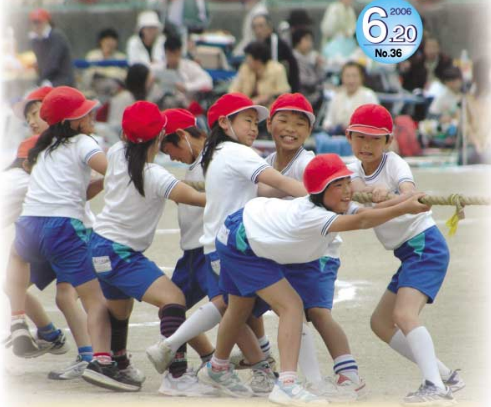
西小学校3年生による「綱引き 2006」