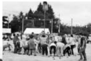
運動会 高齢者との玉入れ