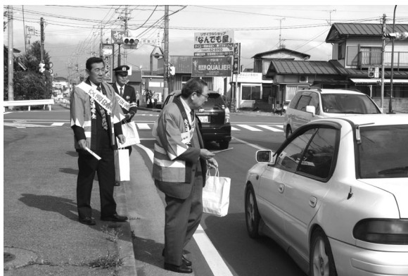
街頭PRを行う市長・議長

初日には、共墾社交差点ほか市内7カ所で、運転者や歩行者に啓発用品を配布しながら交通安全運動を周知し、街頭指導を行いました。