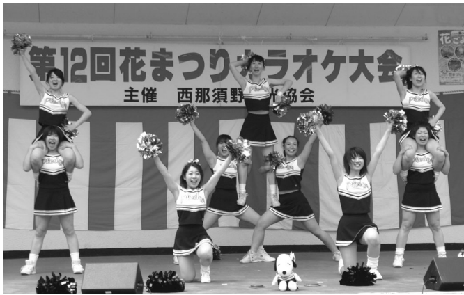
「PLEGGE」によるチアリーディング