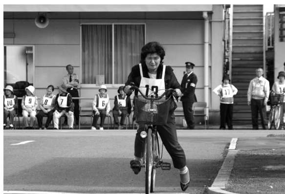
自転車に乗り実技試験