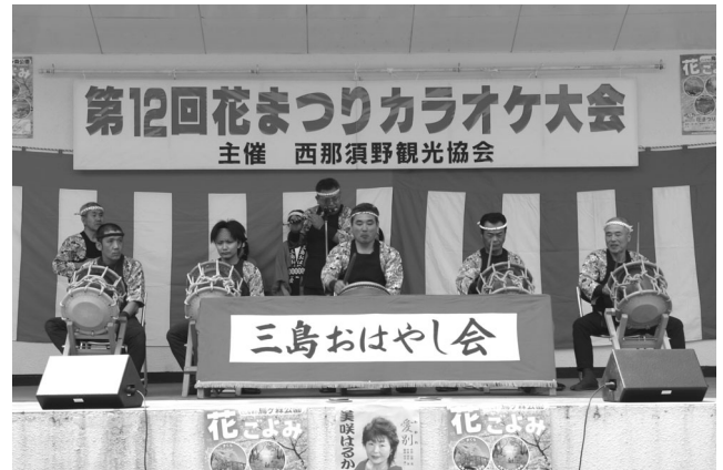
三島おはやし会による郷土芸能披露