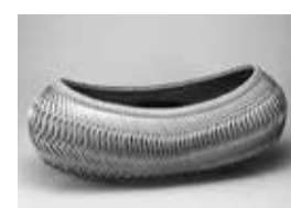
《束縷花籃(気)》 藤谷昇