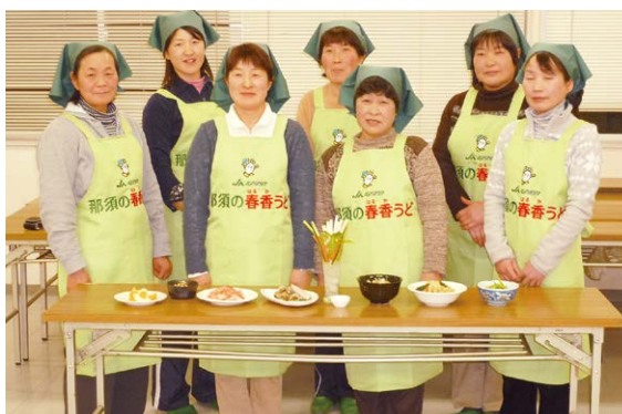
レシピを考案した春香うど生産者の皆さん