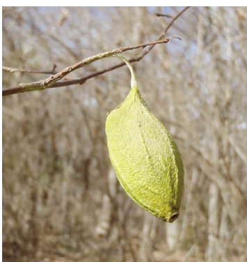
ウスタビガの空繭

昨年12月下旬に、クリーンセンター施設内の雑木林で、クワガタの産卵調査を実施しました。クリーンセンターでは、共生学習室が中心となつて周辺林の自然再生事業を行っています。その一つとして、初冬のこの時期、クワガタの産卵状況を見るために、林内を歩き回りました。少し歩くと汗ばむくらいなのに、この日、一本一本倒木を丹念に見ていくと、ありました！「この木には、私が卵を産みましたヨ！」という、コクワガタのお母さんが残した二重丸が。コクワガタのメスは、産卵をするとき1個ずつ、このマーク(産卵