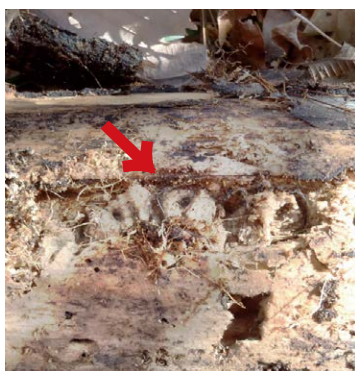
森の二重丸 (コクワガタの産卵痕)

昨年12月下旬に、クリーンセンター施設内の雑木林で、クワガタの産卵調査を実施しました。クリーンセンターでは、共生学習室が中心となつて周辺林の自然再生事業を行っています。その一つとして、初冬のこの時期、クワガタの産卵状況を見るために、林内を歩き回りました。少し歩くと汗ばむくらいなのに、この日、一本一本倒木を丹念に見ていくと、ありました！「この木には、私が卵を産みましたヨ！」という、コクワガタのお母さんが残した二重丸が。コクワガタのメスは、産卵をするとき1個ずつ、このマーク(産卵