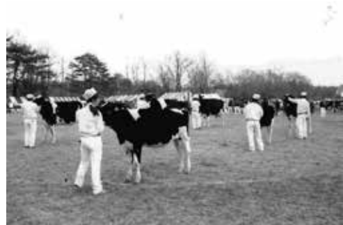
昨年の青木ホルスタイン共進会の様子