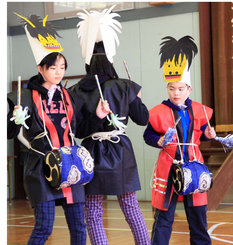
手作りの獅子頭と衣装を身にまとい踊りました

2月24日、第22回栃木県郷土芸能大会が開催されました。このイベントは地元の郷土芸能を紹介するため、毎年県内から会場を選んで行われており、今年は三島ホールで開催されました。今年には県内から郷土芸能を伝える10の団体が出演し、本市からも東那須野おはやし会、那須苗取り田植唄保存会、関谷城鉦舞保存会、那須野ヶ原疏水太鼓の4団体が出演し、それぞれの個性豊かな演技で会場を沸かせました。