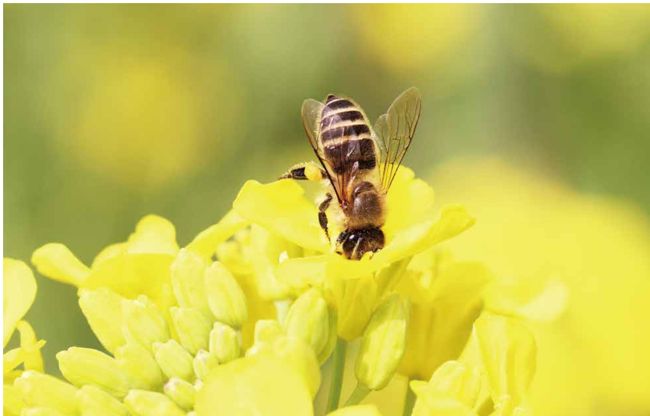
ニホンミツバチ 撮影日時：2011/4/29/10:08 撮影場所：那須塩原市青木