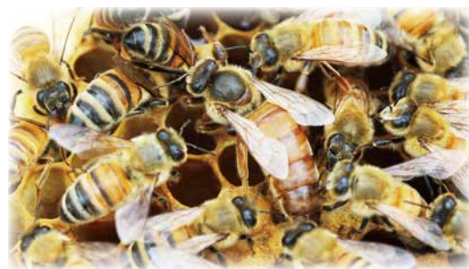
セイヨウミツバチの女王バチと働きバチ