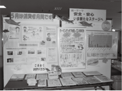
昨年のパネル展示の様子