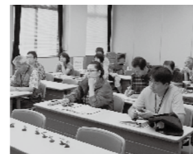
幅広い年代の受講生たちが集まり、熱心に講義を聞いています