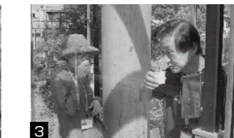
3 湯っ歩の里で温泉を試飲。不思議な味わいがあります