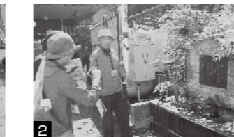
2 普段見過ごしてしまうようなまちかどで旧跡を発見！