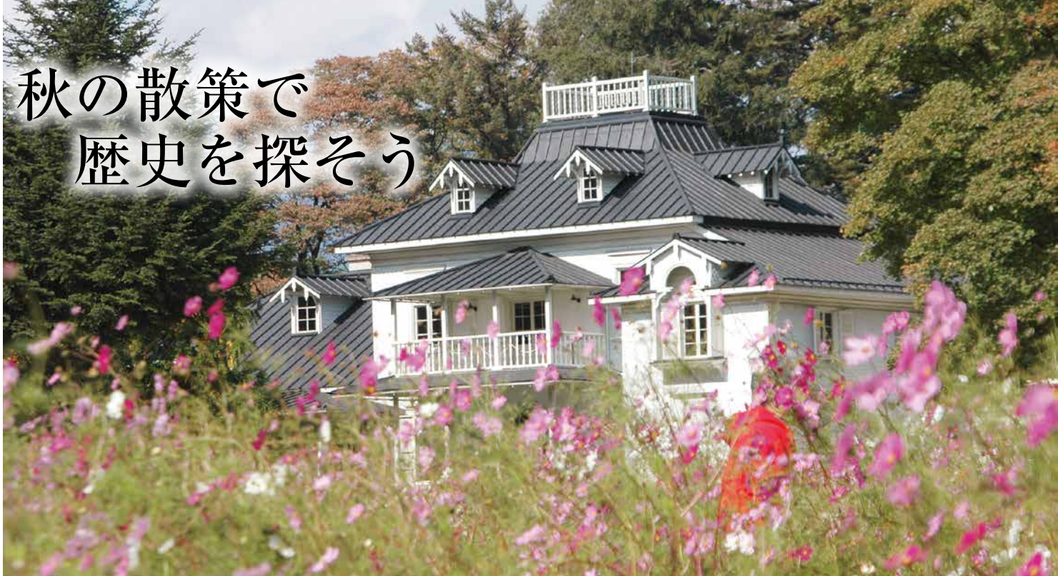
↑ コスモスが彩る秋の青木別邸