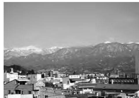
長野県飯田市街 南アルプスが連なる

本市では、市内の再生可能エネルギー事業者や太陽光発電施設業者、地域金融機関、青年会議所、商工会等のメンバーによって「那須塩原市太陽光発電事業者設立準備会」が組織されました。 準備会の設立の趣旨は、市民ファンドを活用して、太陽光発電設備を設置し、売電収益の一部を市民に還元する太陽光発電事業やその他の再生可能エネルギーを活用する仕組みなどの検討を進めていくことです。 ※市民ファンドとは、市内外の人から出資を募り、その出資金を運用する事業です。