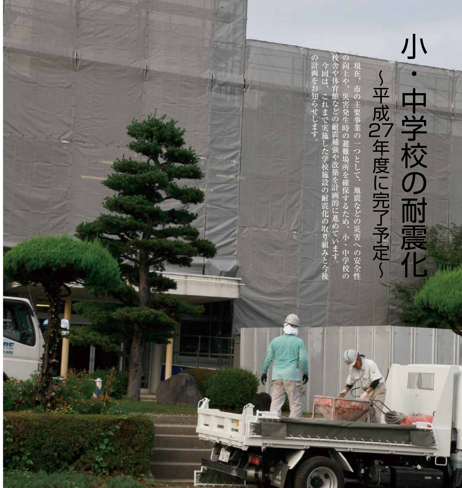
↑現在、管理特別教室棟の耐震改修工事を行う箒根中学校の様子

現在、市の主要事業の一つとして、地震などの災害への安全性の向上や、災害発生時の避難場所を確保するため、小・中学校の校舎や体育館などの耐震補強や改築を計画的に進めています。今回は、これまで実施した学校施設の耐震化の取り組みと今後の計画をお知らせします。