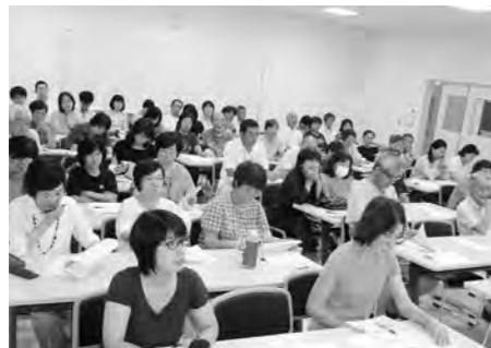
真剣なまなざしで講演を聞く参加者

講演後、参加者からは「食品に対する『なんとなく不安』が解消され、家庭菜園に対する意識が高まった。」「日々の生活の参考になった。」などの声が多数届いている一方、「放射能についてはまだまだ分からないことがあり、今後も注意が必要だと再認識した。」という感想も聞かれました。