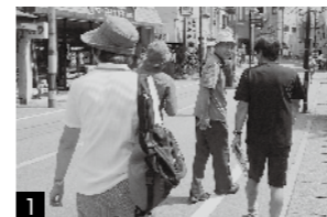
1 案内人と共に、温泉街の散策がスタート

案内人の話は、塩原温泉の歴史や文化を知るだけでなく明るく楽しく親切な「おもてなし」の心が感じられ、素晴らしい楽しい道中でした。皆さんもぜひ利用してみてください。