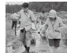
遊びも勉強の内。童心に帰ってみんなで川遊びを楽しみます

回はそれらを目にすることもできませんでした。指導者の豊富な知識が体験を交えて分かりやすく伝えられ、参加した人たちも有意義な体験ができました。 参加者には市外や県外の人もいて、たくさんの方が塩原温泉の魅力を楽しんでいます。これからはマイスター学院では、一人一人が楽しみながら、塩原の魅力を守り、伝えてくれると思います。塩原温泉を訪れる人が「来てよかった、また来よう」と思えるような、心に残る温泉地になっていくと思います。取材を終えました。