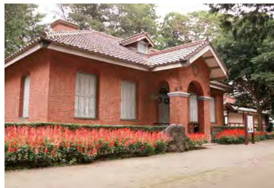
↑ 調度品などが納められた大山別邸