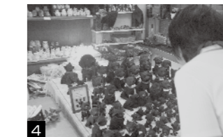
4 温泉街の商店も紹介され、お土産もばっちりでした