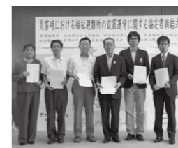
力を合わせて、皆さんが避難所で安全に過ごせる環境をつくります

民間福祉避難所は、災害時に指定避難所での生活に特別の配慮を要する高齢者や障害者などの避難先となるものです。バリアフリー環境やケア体制が整備された市内6法人施設を指定しました。