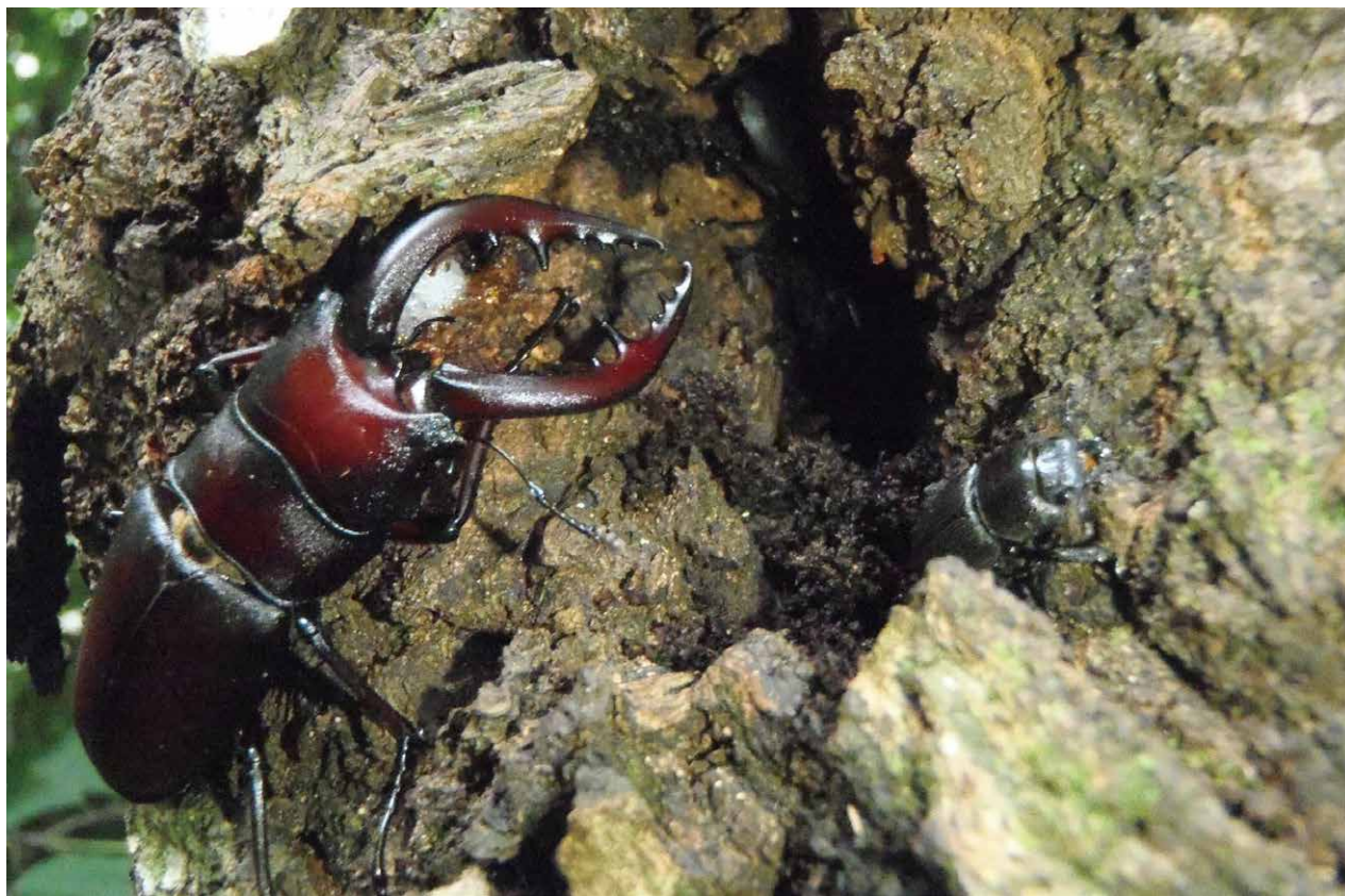
にらみをきかず大きなノコギリクワガタ 撮影日時:2015/7/15/15:44 撮影場所:那須塩原クリーンセンター