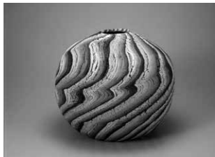
松井康成《練上嘯裂文大壺 西遊記》 東京国立近代美術館蔵