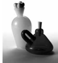
高橋禎彦《花のような》