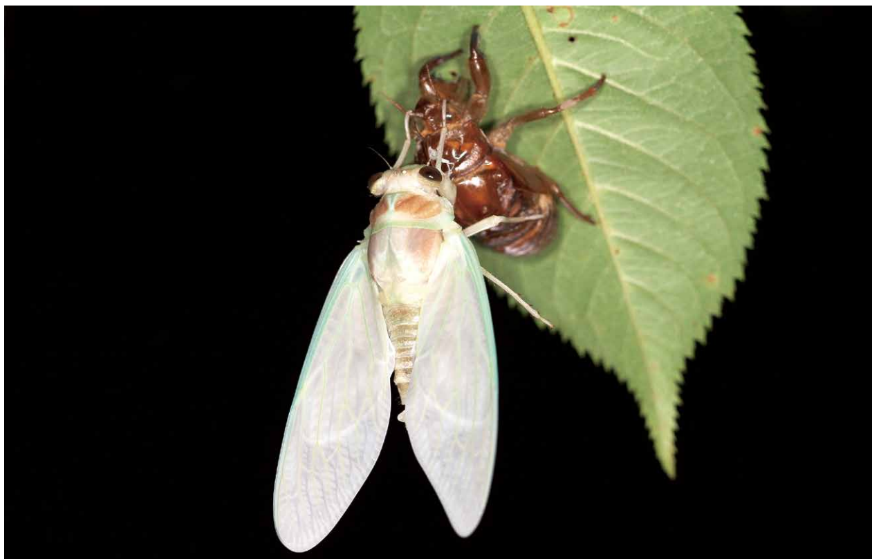
アブラゼミ 撮影日時:2013/7/23/22:37 撮影場所:三区町烏ヶ森公園