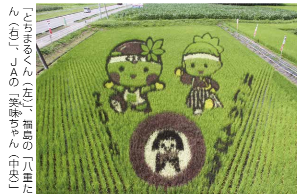
「こちまるくん(左)、福島県の「八重たん(右)」、JAの「笑味ちゃん(中央)」

1年がかりで新品を手に入れた会員の皆さんは、「卓球はもちろんだが、古紙の回収もみんなで協力して楽しくやっている。これからも続けて、もう1台購入したい」とうれしそうに話していました。