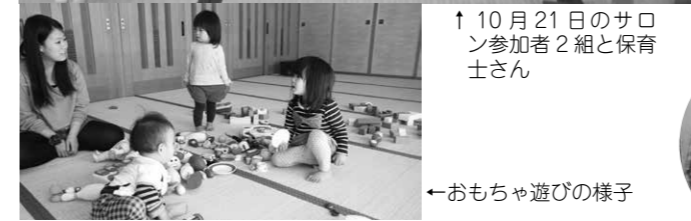
↑ 10月21日のサロン参加者2組と保育士さん