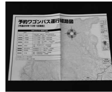
↑予約ワゴンバスの運行経路図

運行路線 予約ワゴンバスは、8つの路線で運行しています。各路線の概要は、P5〜6のとおりです。 なお、各路線の時刻表や停留所など詳しい内容は、各施設で配布している「運行経路図」や市ホームページで確認してください。 【配布場所】 生活課、市民福祉課、総務福祉課、箒根出張所、各公民館、各図書館