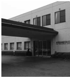
↑那須脳神経外科病院

運行経路 ・豊岡～那須脳神経外科病院～JR黒磯駅 ・豊岡～那須高原病院～JR黒磯駅 主な停留所 豊岡、寺子十文字、寺子小学校前、那須高原病院前、那珂川、鍋掛公民館入口、那須脳神経外科病院、鍋掛小学校入口、日新中学校前、黒磯保健センター前、JR黒磯駅 運行回数 上下線とも1日7回（那須高