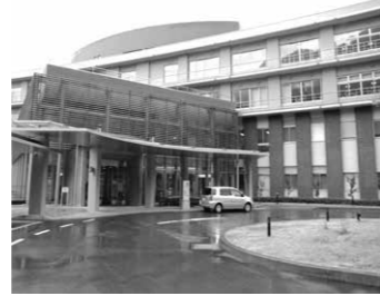
↑医師会塩原温泉病院

運行経路 ・新湯公民館〜塩原支所〜医師会塩原温泉病院 ・上の原集会施設〜塩原支所〜医師会塩原温泉病院 停留所 新湯公民館、寺の湯前、上の原集会施設、宮島、木の葉化石園入口、塩原支所、医師会塩原温泉病院 運行回数 上下線とも1日6回(新湯公民館発着が3回、上の原集会施設発着が3回です)