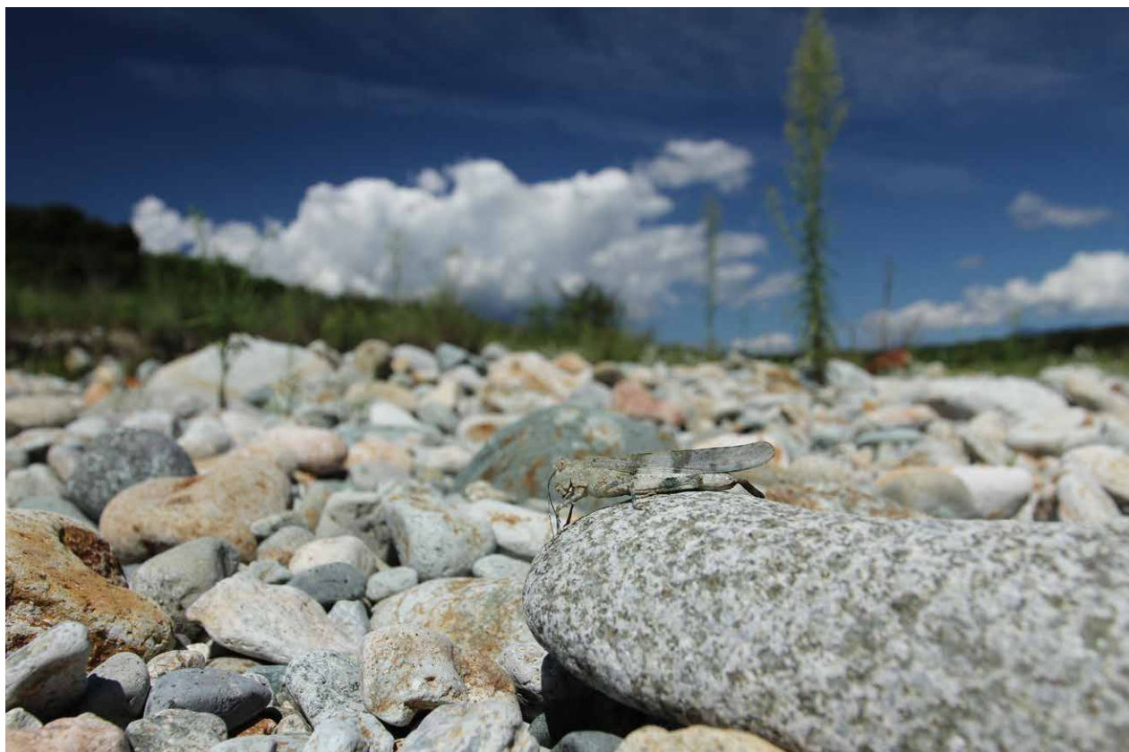
カワラバッタ 撮影日時:2013/9/9/11:01 撮影場所:市内蛇尾川河川敷