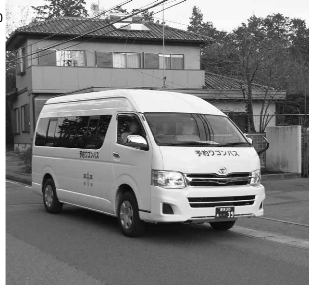
→10人乗りの予約ワゴンバス。乗降口にステップが設置され、高齢者もスムーズに乗り降りができます

ゆーバスとの違い 運行ルートの違い以外にも、次の2つの点がゆーバスと異なります。 ① 10人乗りのワゴンバス ② 予約をしないと利用できない(運行しない) ※運行日や運賃は一緒です。