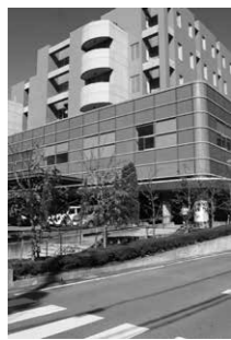
↑国際医療福祉大学病院

運行経路 ・アグリパル塩原〜折戸・接骨木〜JR西那須野駅 ・アグリパル塩原〜塩原リゾートタウン・接骨木〜JR西那須野駅 主な停留所 アグリパル塩原、折戸公民館前、横林小学校、国際医療福祉大学病院前、三島中学校入口、西那須野公民館前、西那須野庁舎、JR西那須野駅 運行回数 上下線とも1日7回(折戸公