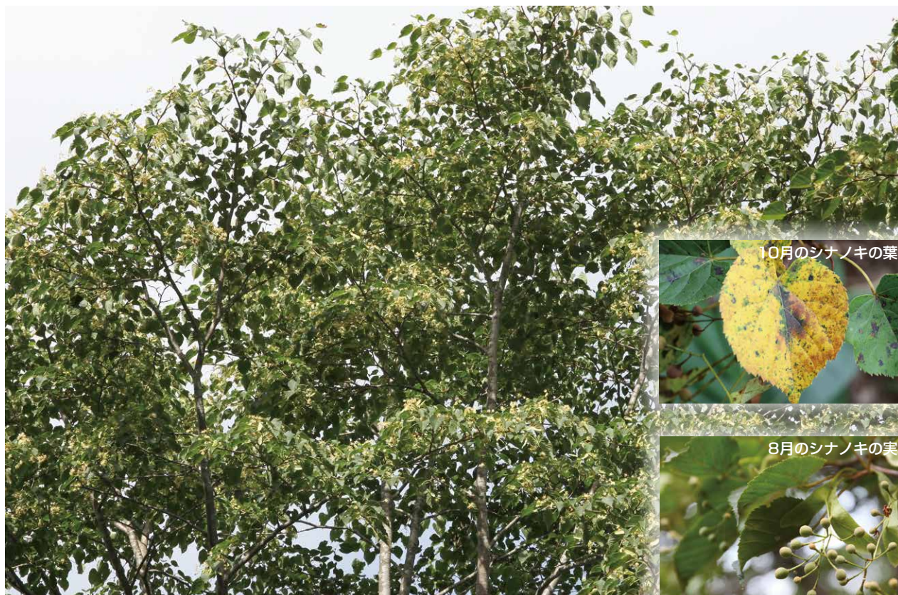
シナノキ 撮影日時:2013/7/28/8:01 撮影場所:板室地内沼ッ原湿原