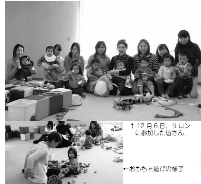
↑12月6日、サロンに参加した皆さん