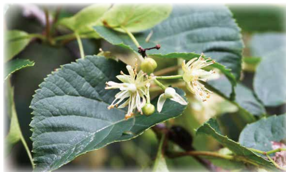
7月のシナノキの花