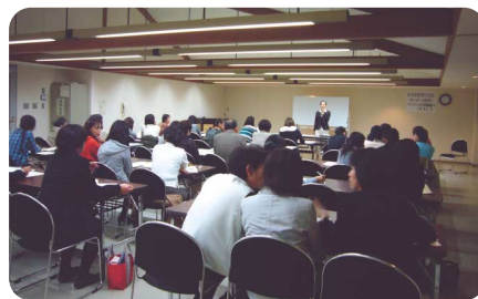
隣りの人と互いの変換作業中!!