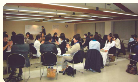
相手を変えてのコミュニケーション演習

セミナーの最終回でしたので、全4回中、3回以上出席した32名が修了証を受け取りました。