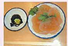
さしみこんにゃく