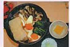
あつあつのうどん